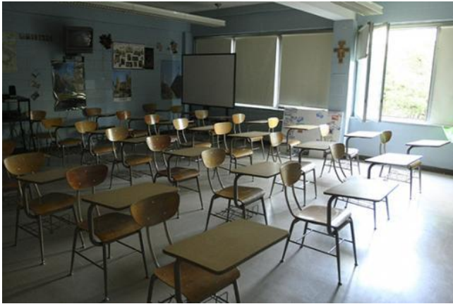
Salón de clases. Foto de referencia - EFE

Yolanda Villavicencio, coordinadora del Grupo contra la trata de personas, habló en Vive Bogotá sobre el panorama de esta problemática en la ciudad de Bogotá, luego de que el alcalde mayor, Gustavo Petro , denunciara que jóvenes de estratos altos en Bogotá, que consumen droga y no pueden pagar sus deudas, son tratadas como esclavas de servicios sexuales en el Bronx .