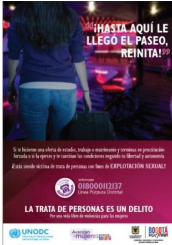
Afiche original de la Campaña, contra la Trata de Personas.

los sentidos es la mujer que va de viaje, el lema en mayúsculas grandes y a su vez el color rosado de las comillas que lo destacan. Es una manera de mostrar a la mujer como un ser vulnerable; por consiguiente, fácil de engañar, de usar y maltratar. En consecuencia, se victimiza más a la mujer y se apoya de manera indirecta la trata de personas.