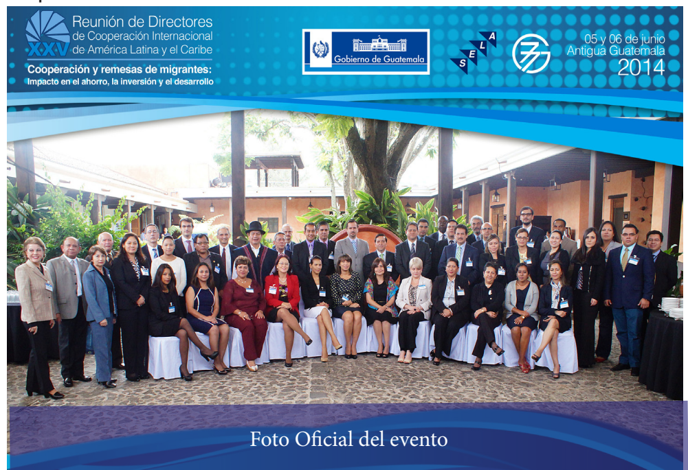
Foto Oficial del evento

Un aspecto importante de los países que conforman la Comunidad Andina (Perú, Ecuador, Colombia y Bolivia) además de la intensiva migración entre estos países, es la fuerte presencia migratoria internacional que se manifiesta en una significativa presencia de migrantes andinos que viven en Estados Unidos, Canadá y, en especial, Europa.