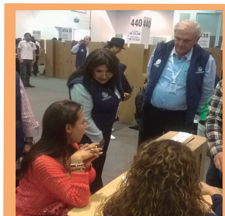
La Misión recorrió varios puestos de votación en Bogotá, capital colombiana.