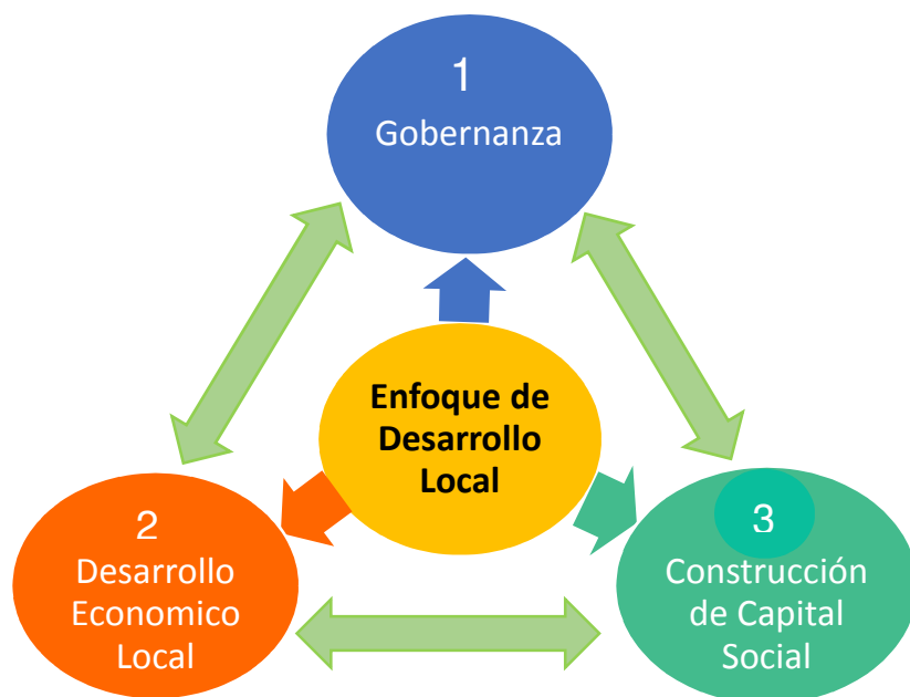
Gráfico 1: Elementos Inseparables del Desarrollo Local

Comenzaremos por analizar los 3 elementos inseparables del Desarrollo Local, comparados con la estrategia de la ADEL, haremos énfasis en el Desarrollo Económico y Gobernanza como los principales elementos.